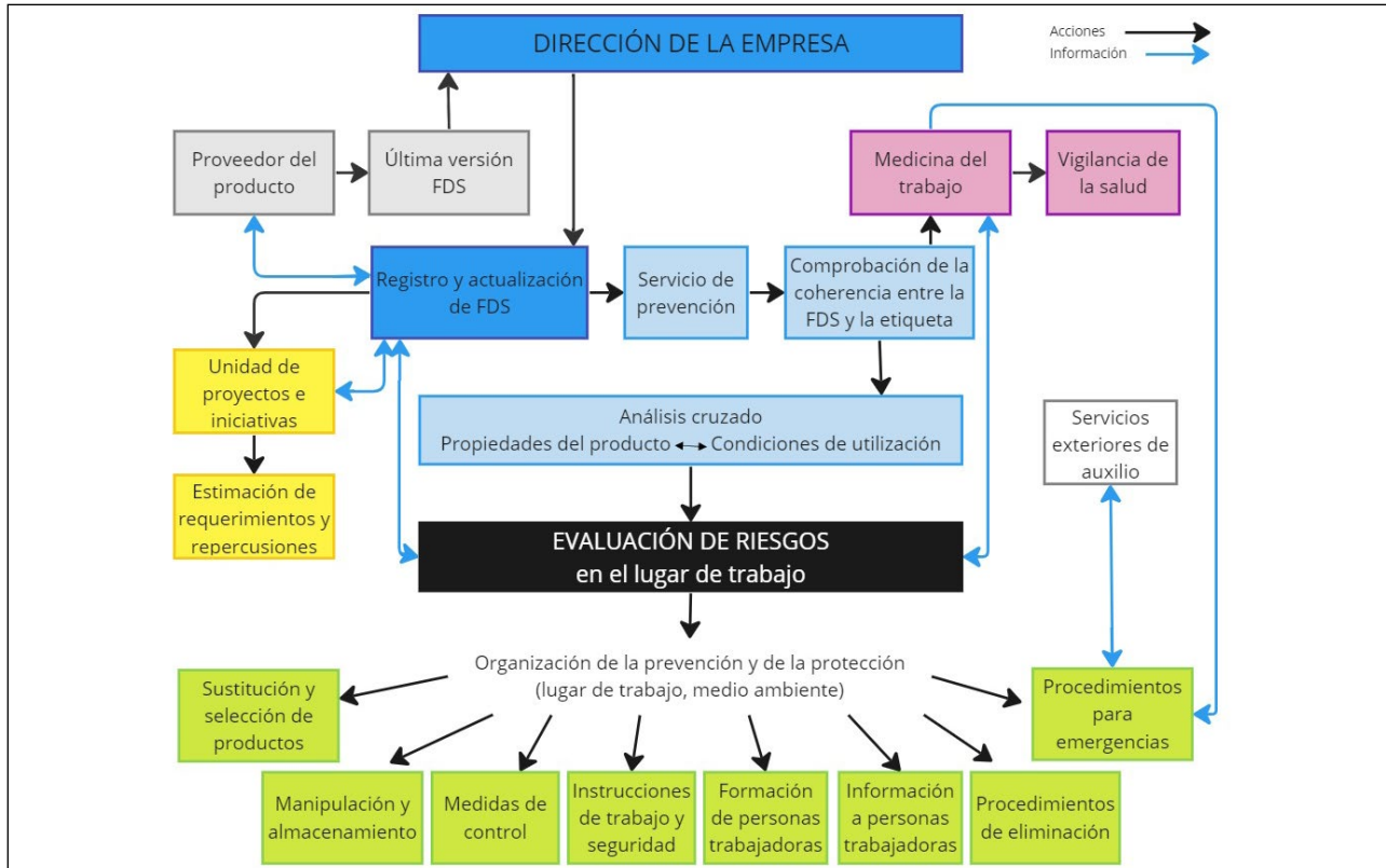
Figura 2. Gestión y utilización de la ficha de datos de seguridad

En la práctica, para usar de forma segura una sustancia o mezcla química es necesario tener en cuenta la información contenida en diferentes secciones de su FDS. En la tabla 1 se expone, a modo de ejemplo