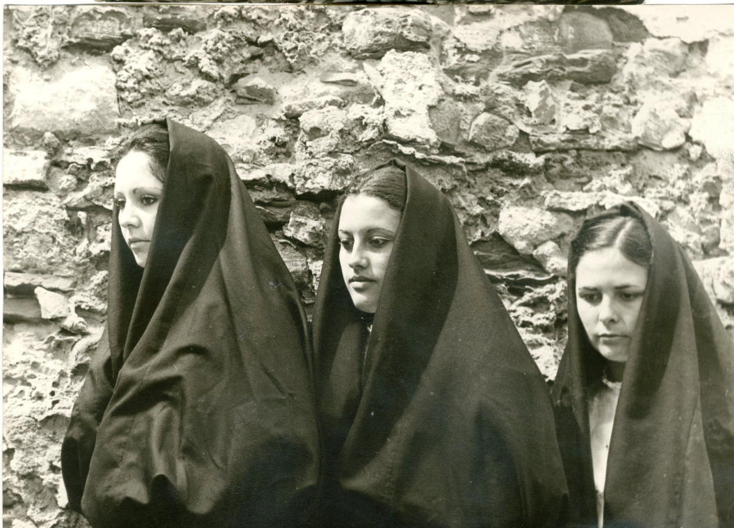
Fotografías del traje típico de Tarifa y Vejer de la Frontera