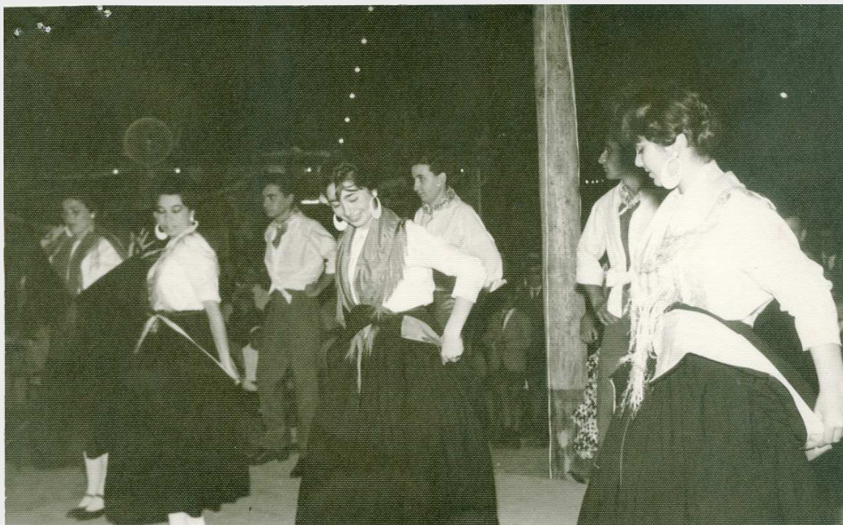
Grupo provincial de Coros y Danzas de la Sección Femenina