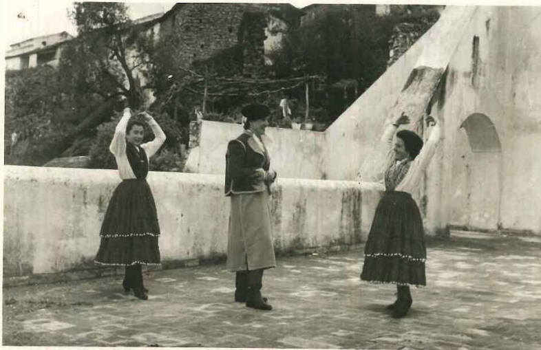
Informe y boceto del traje típico de Jimena de la Frontera