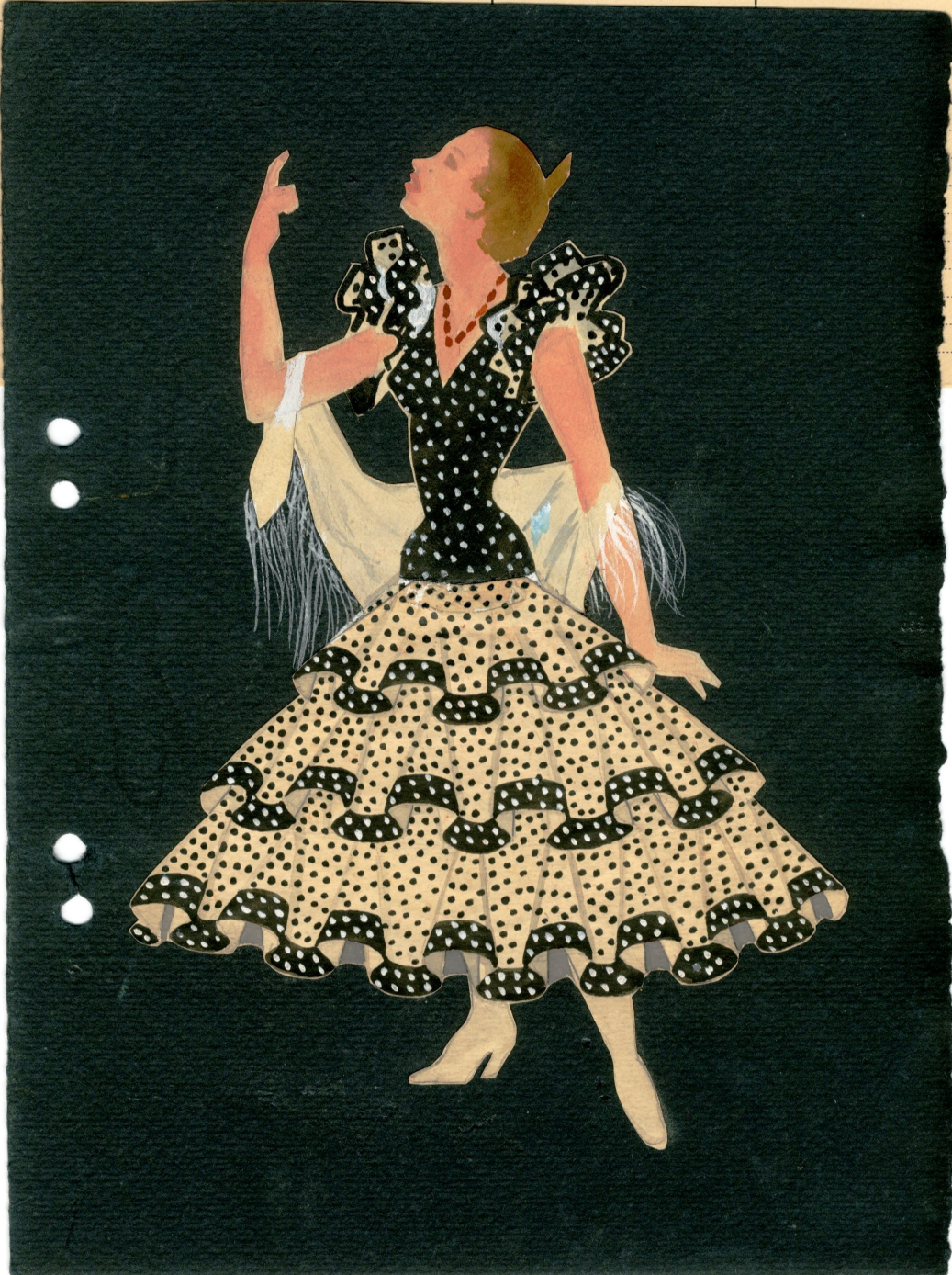
Informe y boceto del traje típico de Jerez de la Frontera