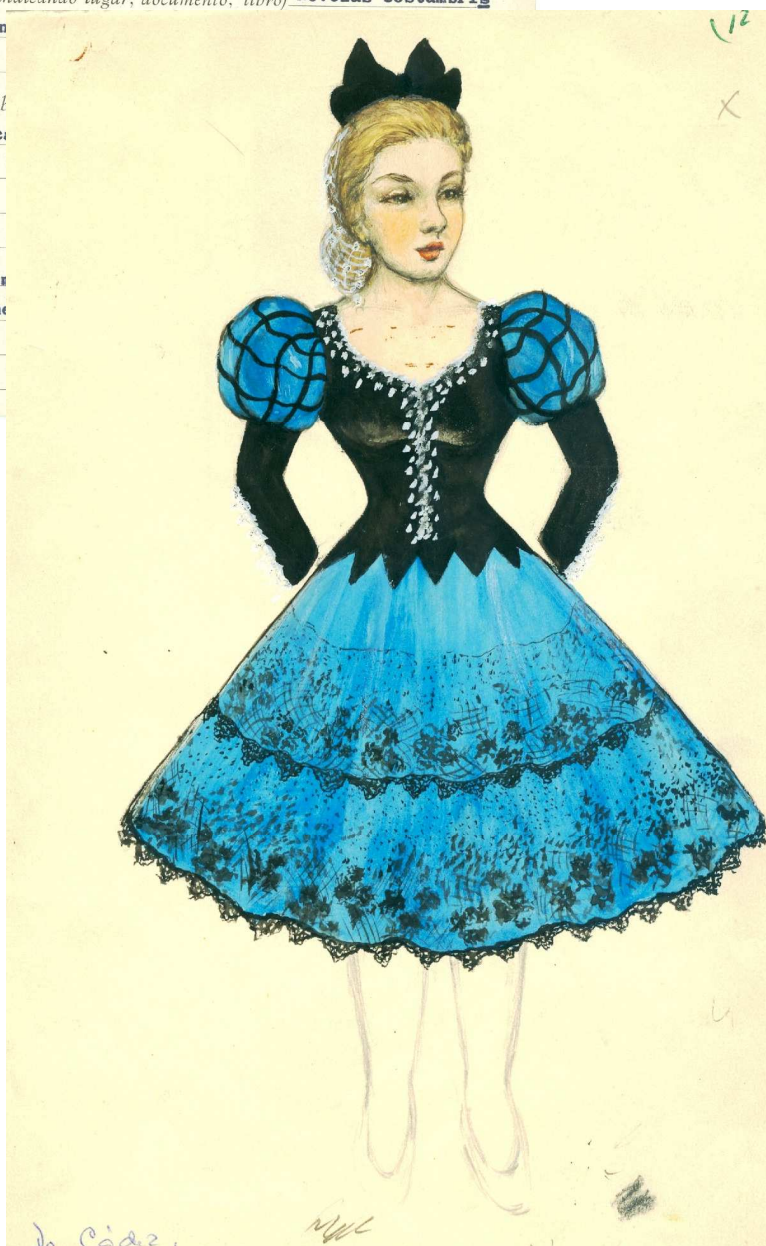
Informe y boceto del traje típico de piconera

Modificaciones sufridas en el traje El actual está un castillo bajo el talle. Escote, ligerame que son pequeños detalles.