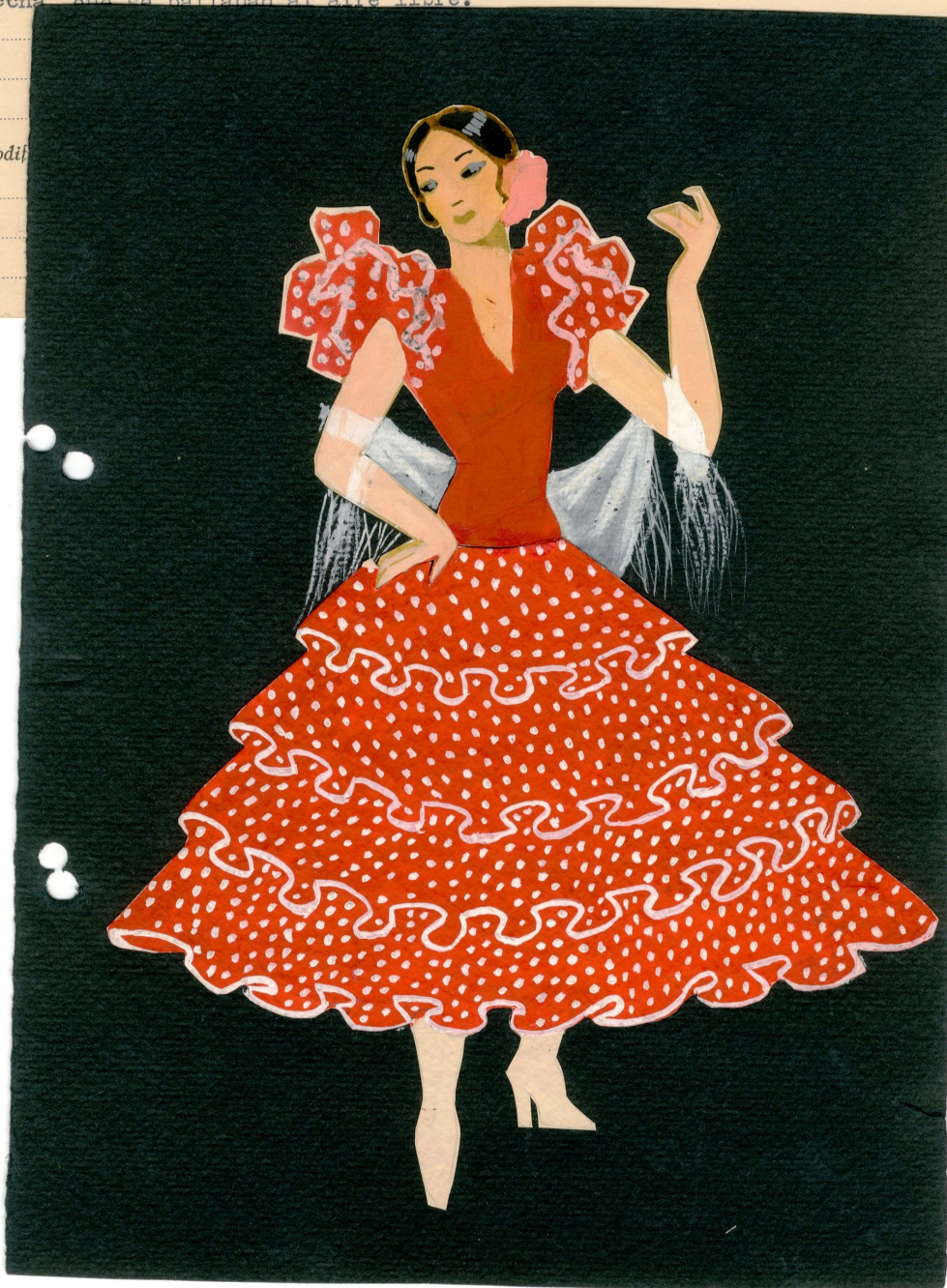
Informe y boceto del traje típico de Jerez de la Frontera