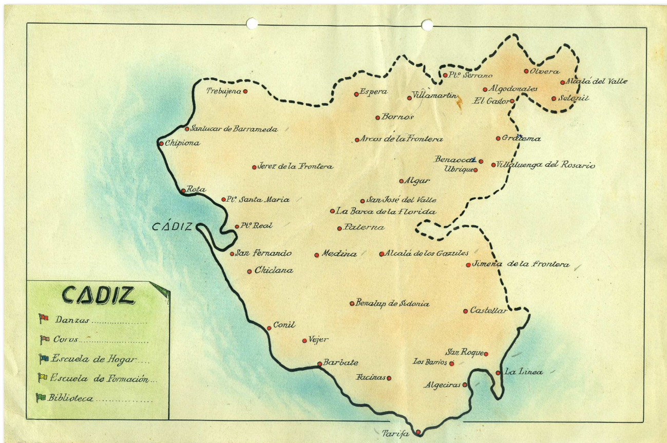
Mapa estadístico de las actividades de la Sección Femenina, Ca. 1970