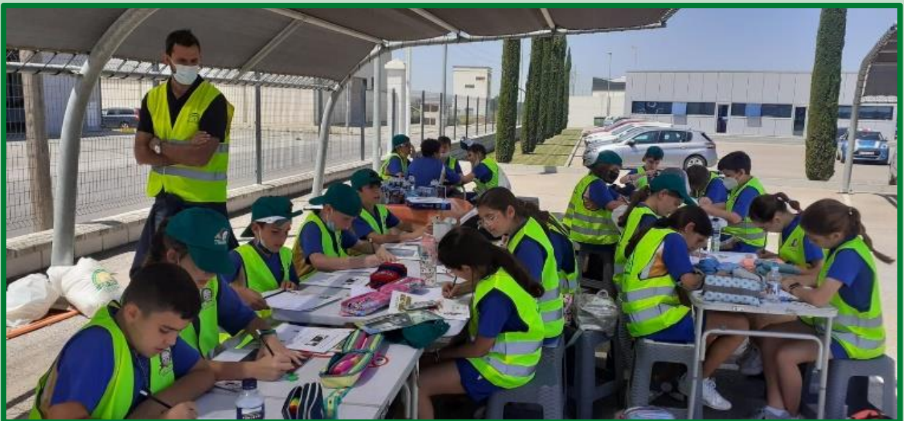
Foto en grupo

A los niños ganadores se les entregará un pequeño obsequio.