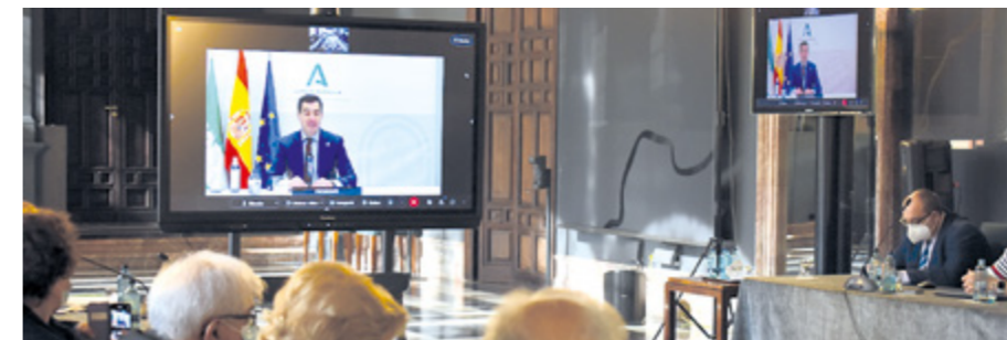
Sesión del Pleno del XII Consejo de Comunidades Andaluzas de 2021