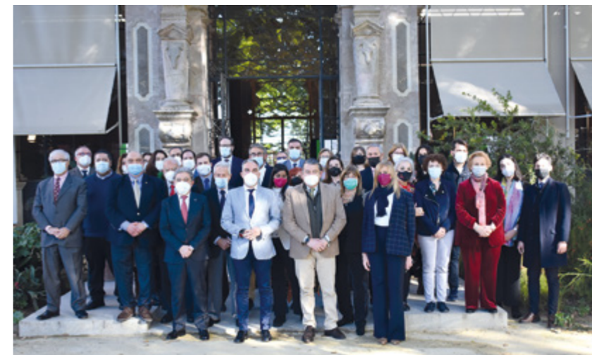
Asistentes a la sesión del Pleno del XII Consejo de Comunidades Andaluzas de 2021