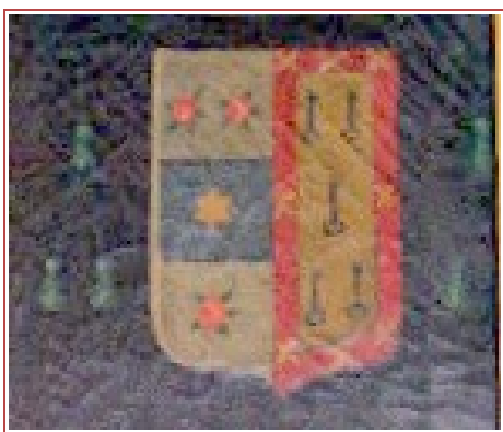
Escudo de Justino de Neve 1

El orgullo de pertenecer al estado hidalgo, queda patente al aparecer en los retratos de Justino de Neve la expresión del blasón familiar. El completo resumen del pleito que conforma la ejecutoria, incluye también la fase de la probanza y toma de declaraciones de los testigos en la que éstos responden a la pregunta formulada por el receptor, sobre si habían conocido y visto que los litigantes y sus ascendientes trayeran armas y blasones, para usar en sus casas solares, enterramientos, muebles y vestidos. Uno de los testigos declara al respecto de los De Neve: “[...]en contrario y así mismo que los descendientes della auían usado de sus armas y blasones distintas y separadas de las de otras familias las quales eran vn escudo blanco con tres rossas carmesíes y una banda açul trauessada; enzima del dicho escudo un morrión auuerto con plumas blancas y carmesíes y enzima un león de pié”. Aún más otro testigo añade una figura del blasón olvidada por el anterior declarante: “[...] las quales dichas armas eran vn escudo blanco con tres rossas carmesíes y una banda açul que lo atrauesaua y una estrella enmedio y un morrión encima del escudo con plumas y un león en pié.”