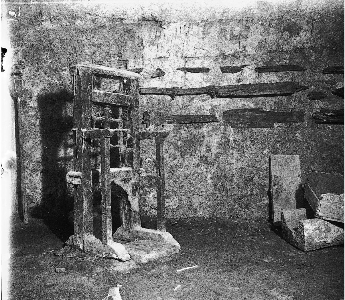
Estructura de madera para la instalación del garrote vil con restos de las cajas para transportar los cuerpos de los ajusticiados localizados en los sótanos del palacio de la Real Chancillería de Granada. José Martínez Rioboo.

ca. 1913, copia moderna a partir de dispositivo estereoscópico sobre vidrio, Fundación Rodríguez-Acosta, Legado Martínez Sola, Granada.