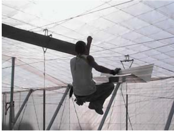
Concurso de Fotografía PREVENCIA2010, Autor: José Pérez Alonso

que la tarea impone (esfuerzos, manipulación de carga, posturas de trabajo, niveles de atención, etc.) asociada a cada tipo de actividad y determinantes de la carga de trabajo, tanto física como mental.