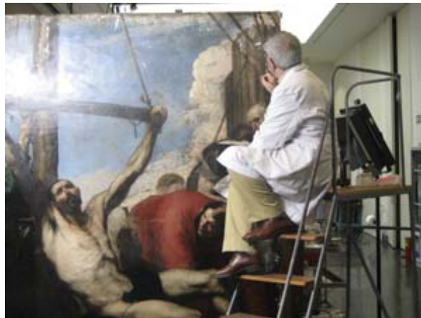
Concurso de Fotografía PREVENCIA2010, Autor: José Angel Romero

Cuando hablamos de salud laboral y, por lo tanto, de salud en el trabajo, no pueden olvidarse las condiciones en que se realiza el empleo, formal e informal , así como el modo en que se presta el trabajo asalariado (los tipos de contratos, la jornada, el reparto de género de las tareas, la doble jornada...). Todos estos aspectos tienen mucho que ver con la calidad de vida y la salud.