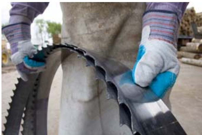
Concurso de Fotografía PREVENCIA2010, Autor: Carolina Camps

Es necesario afrontar el problema desde la base si deseamos corregirlo verdaderamente; Si los accidentes son ocasionados por fallos de gestión, la verdadera prevención se hará en la empresa cuando se contemple en ella las actividades preventivas como otra actividad más a gestionar.