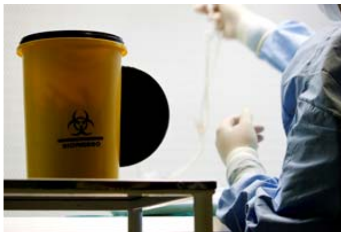
1º Premio PREVENCIA2010, Autor: Carmen Ruiz Martin

En consonancia con la responsabilidad del empleador como gestor de una empresa, no podemos evitar mencionarlos y tenerlos presente, ya que todos estos aspectos influyen negativamente en la cuenta de gestión de la empresa, y en los posibles beneficios económicos de la misma.