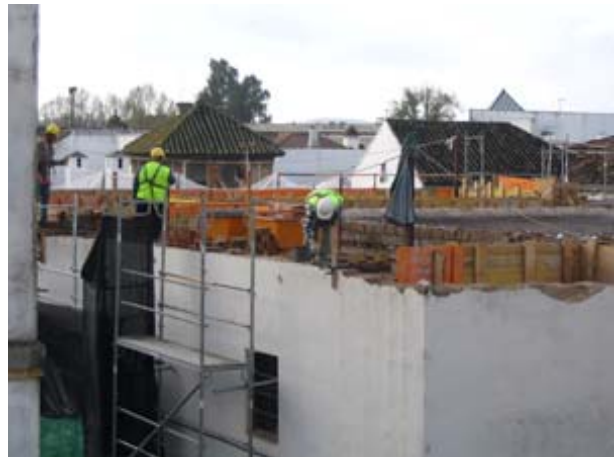
Concurso de Fotografía PREVENCIA2010, Autor: Manuel Poblete Tamara

A pesar de observar este listado, para una pequeña empresa, la estructura organizativa normalmente es poco compleja y la gestión está en manos de unas pocas personas e incluso, en el caso de muchas microempresas, de una sola. La organización de la producción suele ser relativamente sencilla y es poco frecuente que existan tareas cuya complejidad obligue a elaborar un procedimiento complejo y finalmente, su organización y recursos preventivos a menudo se limita a la contratación de un servicio externo. Esta simplificación no puede abandonar la obligatoriedad de proteger a los empleados, pero sí facilitar la propia gestión de la prevención.