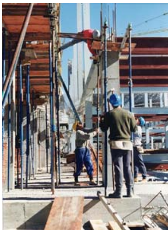
Concurso de Fotografía PREVENCIA2010, Autora: Elisenda Amigó

El sistema de prevención de riesgos laborales, como cualquier otro sistema de gestión, debe estar debidamente documentado.