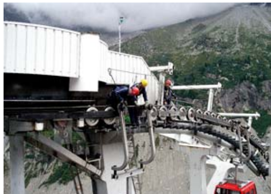
Concurso de Fotografía PREVENCIA2010

A menudo, en un mismo lugar o centro de trabajo, se encuentran empleados de diferentes empresas realizando una actividad, el caso más habitual lo tenemos en la obras de construcción, pero esta situación también se da, por ejemplo, en oficinas estando presentes los trabajadores de la propia empresa y el personal de limpieza que no sean empleados de la misma.