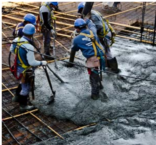
Concurso de Fotografía PREVENCIA2010

Si se ha considerado la Evaluación de Riesgos como una herramienta de Gestión, como la fotografía de las condiciones de trabajo, la Planificación la debemos considerar como una herramienta de trabajo, como el compromiso de corregir las condiciones de trabajo incorrectas o potenciadoras de riesgos. En ella se recogen los riesgos identificados en la Evaluación de Riesgos, la valoración del riesgo realizada y la medidas preventivas propuestas, pero también,