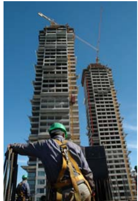
Concurso de Fotografía PREVENCIA2010

En el caso de las pequeñas empresas cuando existe en la misma la representación legal de los trabajadores, esta se convierta en la más recomendable e idónea, teniendo los mismos acceso a toda la documentación en la materia así como haciendo de cadena de transmisión bidireccional con el resto de los empleados.