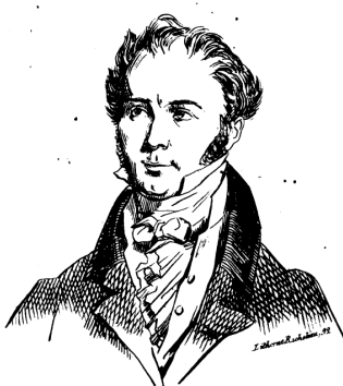
Retrato de Sor.