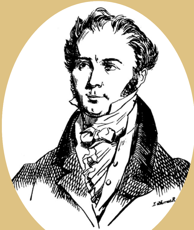
Fernando Sor Muntadas (1778 - 1839)