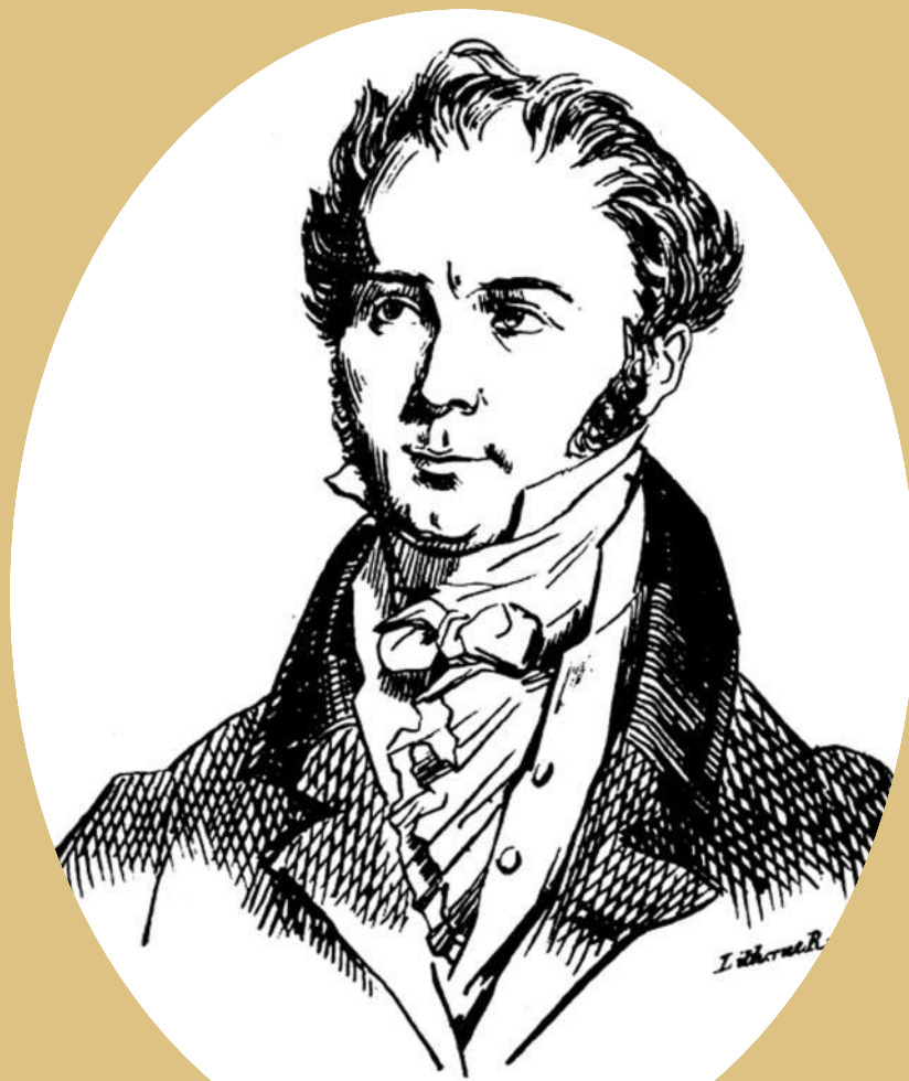
Fernando Sor Muntadas (1778 - 1839)