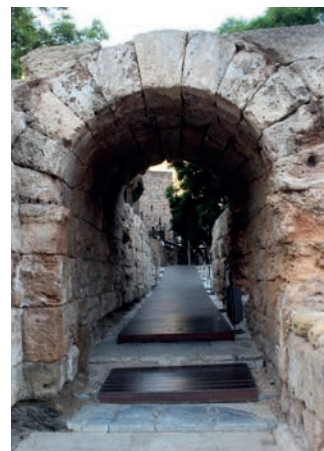
↑ Dos vistas del aditus maximus. →

los teatros romanos, al contrario de los teatros actuales, se elevaba de abajo a arriba.