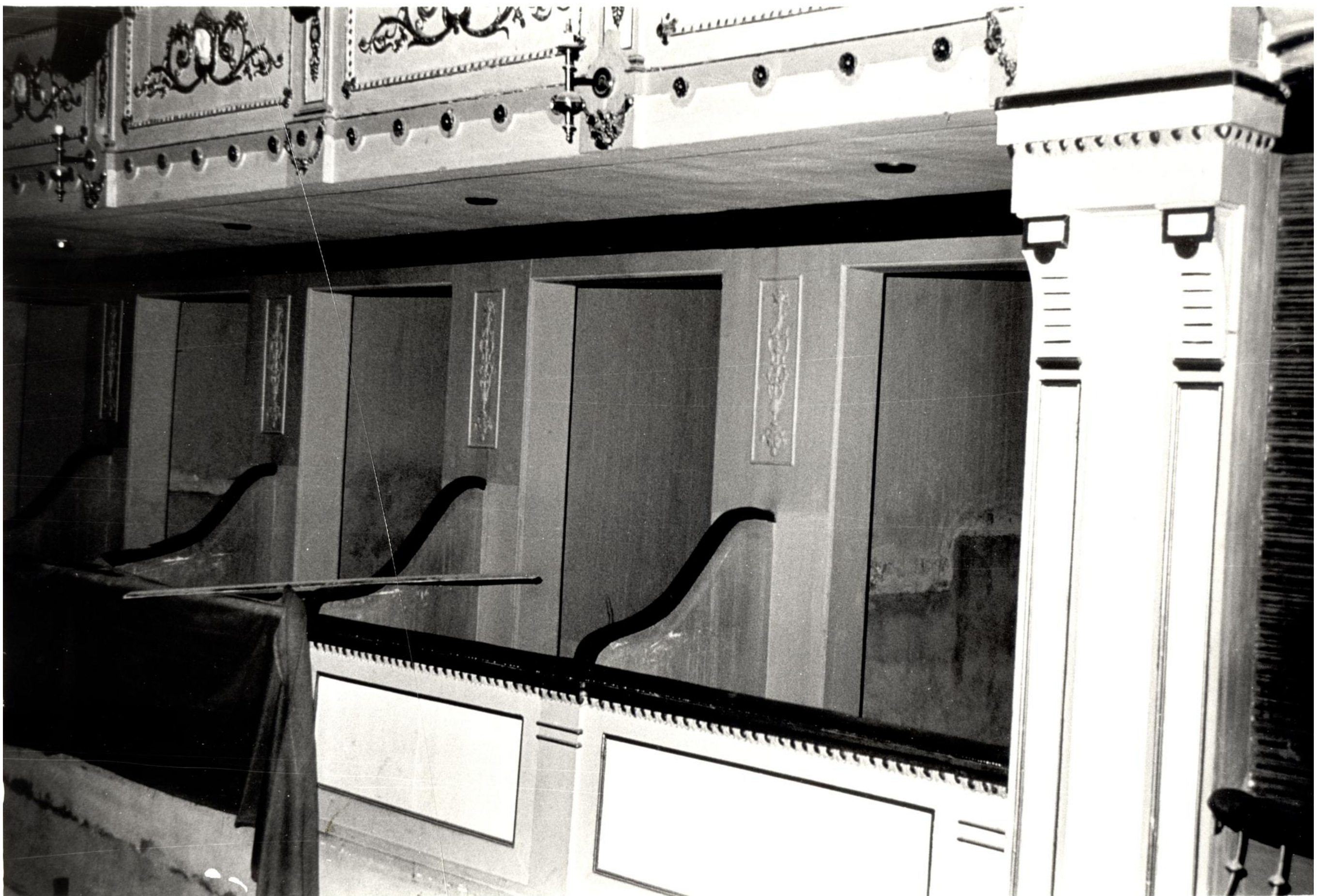
Detalle de los palcos del Teatro Cervantes de Málaga antes de la rehabilitación. Archivo General de Andalucía, B44/1439

El patrimonio arquitectónico que nos ha legado el mundo del teatro se reparte, abundantemente, por Andalucía. Aquí se desarrolla y aplica una de las responsabilidades más importantes por parte de la Administración autonómica: la preservación de los edificios de carácter histórico y valor cultural como palacios, mercados, ayuntamientos y, por supuesto, teatros. En las últimas décadas se han diseñado distintos programas de rehabilitación con el fin de mejorar materialmente los edificios como conservación del patrimonio. Un resultado perceptible es la mejora del entorno de los espacios públicos ya que han revalorizado los centros históricos. Además cabe una función más: la reincorporación de estos inmuebles de destacado valor urbano a la sociedad. De todo ello, poseemos testimonios documentales en el Archivo General de Andalucía.