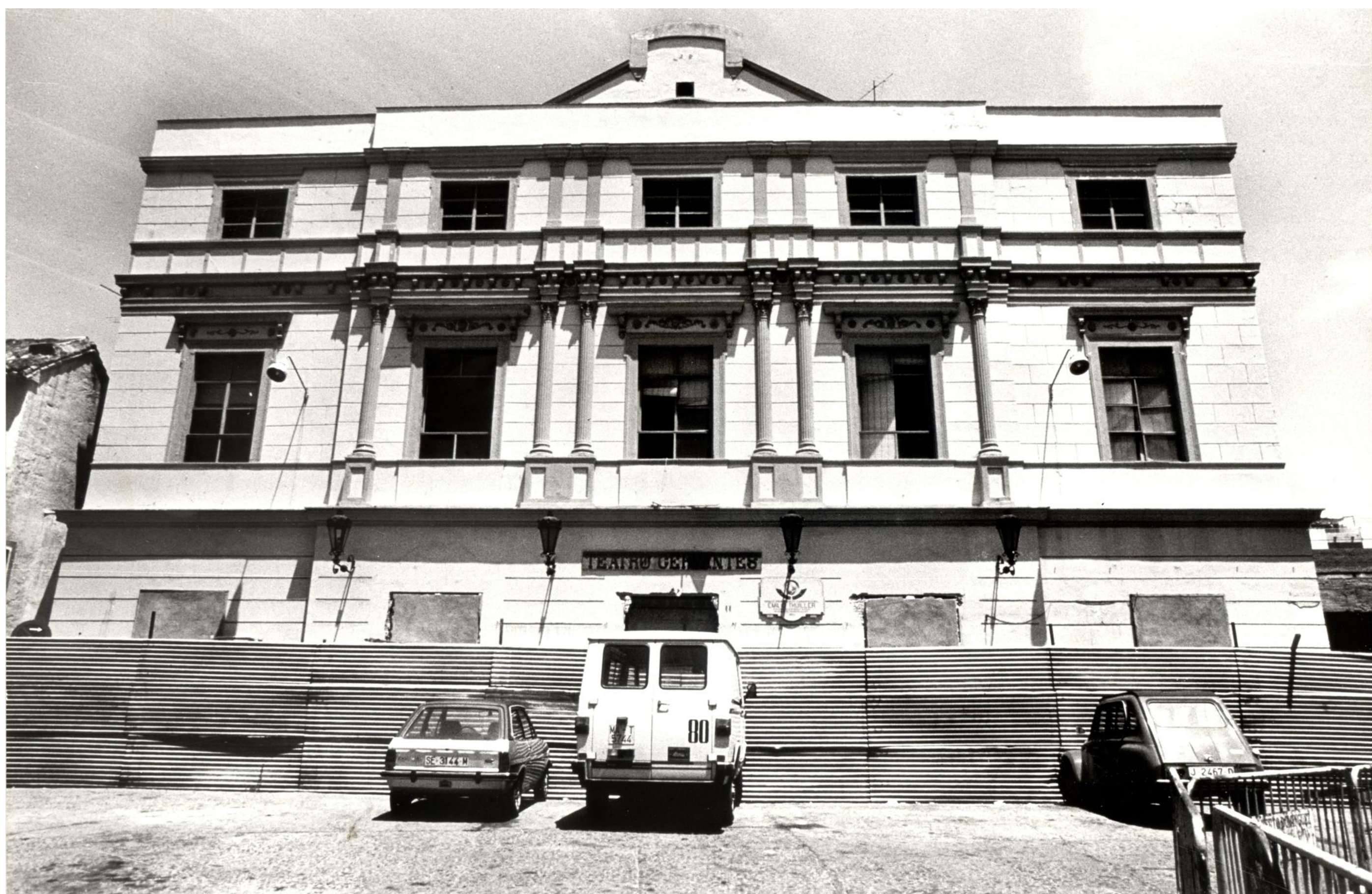
Fachada principal del Teatro Cervantes (Málaga), vista desde la Plaza Jerónimo Cuervo antes de la rehabilitación. Archivo General de Andalucía, B44/1437.