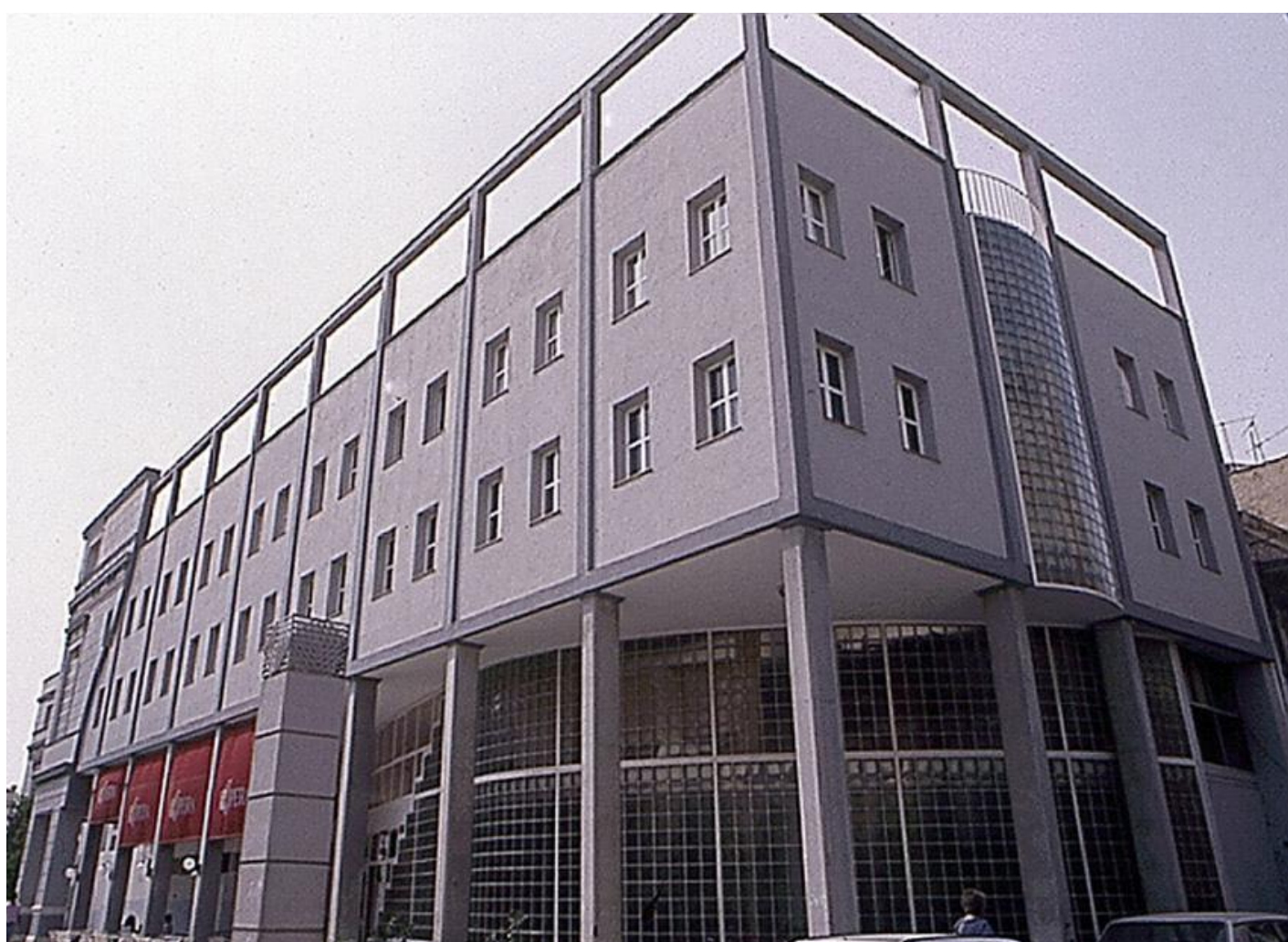
Fachada lateral del Teatro Cervantes (Málaga) tras la rehabilitación.

Al primer piso se accede mediante una pronunciada cornisa. Varias columnas de estilo corintio y de fustes estriados flanquean cada uno de los tres vanos centrales. La zona superior de los cinco ventanales presenta decoración de estucos con motivos vegetales, mascarones en el centro y rosetas en los laterales. Al llegar al segundo piso nos recibe un friso corrido decorado con rosetas, sobre todo en la parte central. Finaliza en un pretil a modo de zócalo corrido separado por franjas horizontales. Los tres vanos centrales están flanqueados con pilastras corintias sobre pedestales. La fachada se remata con una cornisa que da paso al antepecho, terminando en la parte central con un frontón retranqueado en forma de piñón con decoración trilobulada en la parte central.