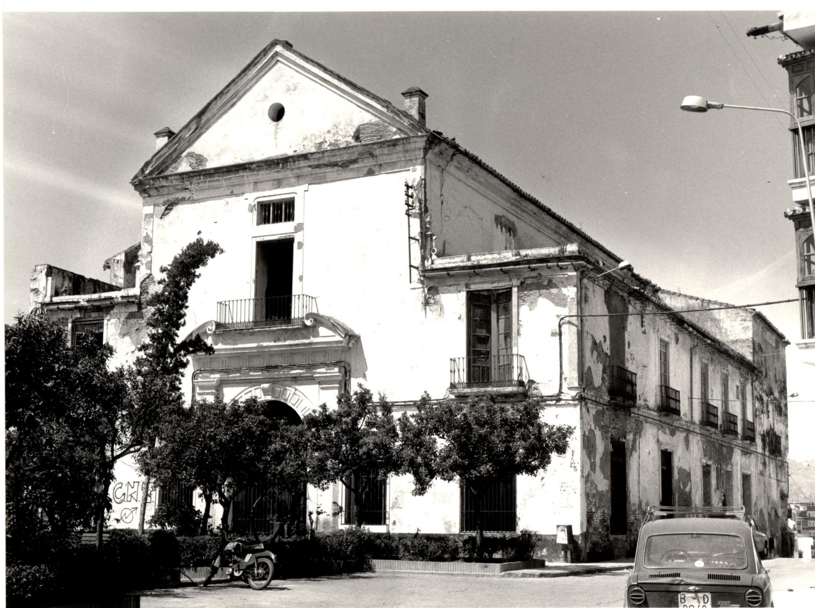
Fachada del Teatro del Carmen, de Vélez Málaga (Málaga), previa a su rehabilitación. Archivo General de Andalucía, B44/1384

El siglo XIX fue testigo de un radical transformación en el diseño de los teatros así como una nueva concepción de los mismos. También hay que añadir que un mayor número de espectadores acudían a las salas de teatro producto de una mejora en el nivel de vida y una acentuación de los gustos culturales, por lo que en España, como en el resto de Europa y América, a lo largo de la centuria del XIX proliferaron la mayor parte de los teatros actuales. El estilo arquitectónico resultará en diferentes modelos teatrales generales, consecuencia de la adaptación de lo teatral a los nuevos espectáculos, y que no desaparecerá ni con la incorporación del cinematógrafo desde comienzos del siglo XX. Algunos teatros provienen de la desamortización decimonónica de edificios religiosos como el Teatro del Carmen de Vélez-Málaga, donde se aprecian signos externos del antiguo convento.