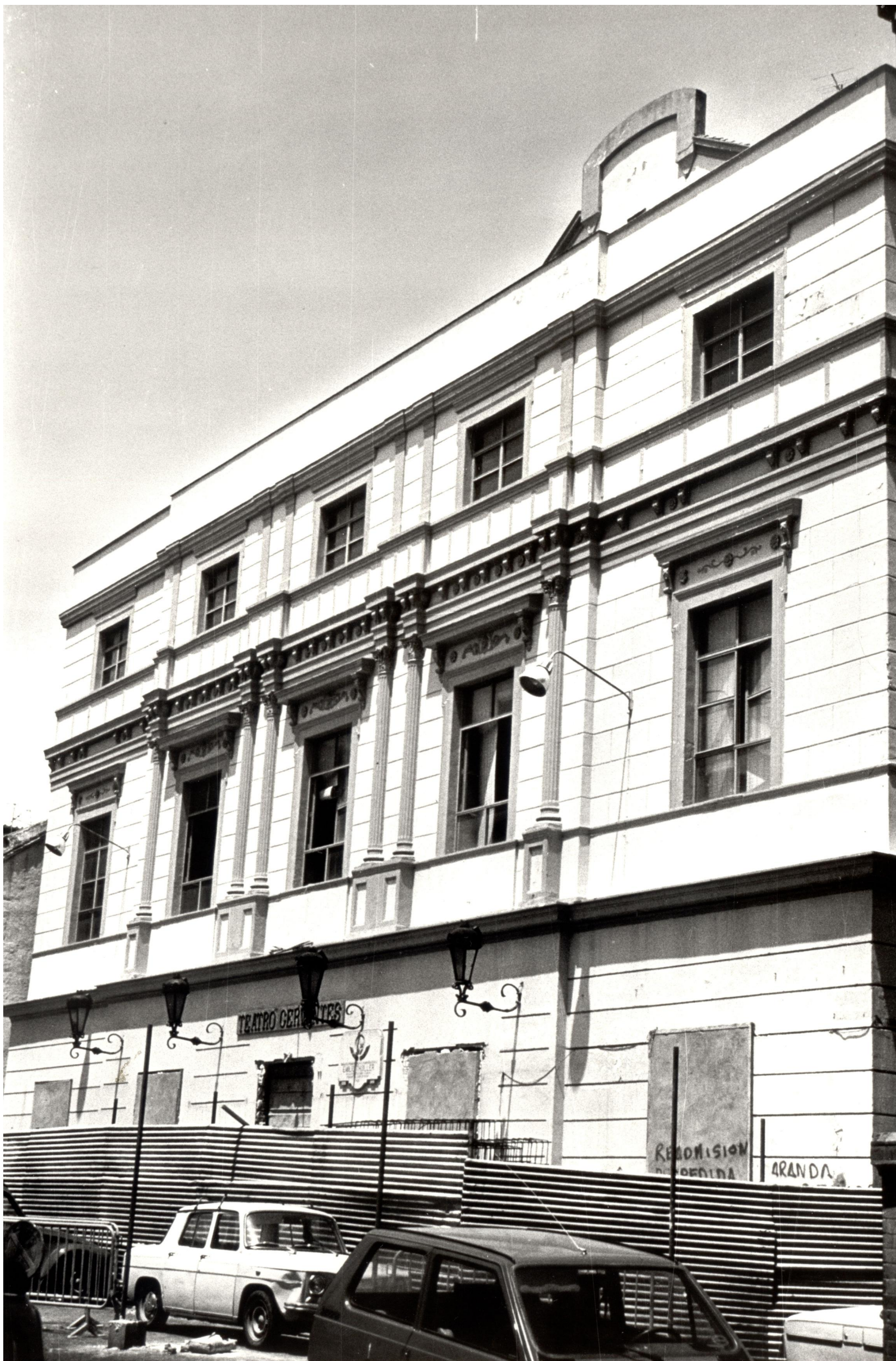
Fachada principal del Teatro Cervantes (Málaga), vista desde la calle San Juan de Letrán antes de la rehabilitación.

El Teatro Municipal Miguel de Cervantes no fue una construcción ex novo, pues entronca sus orígenes con el antiguo Teatro de la Merced, reformado en 1862 con motivo de la visita de la reina Isabel II. Tras algunas remodelaciones, el teatro pasó a llamarse Teatro del Príncipe o de la Libertad, y fue víctima de las algaradas e inestabilidad político-social del Sexenio Revolucionario (1868-1874), pues fue destruido por un incendio en 1869.