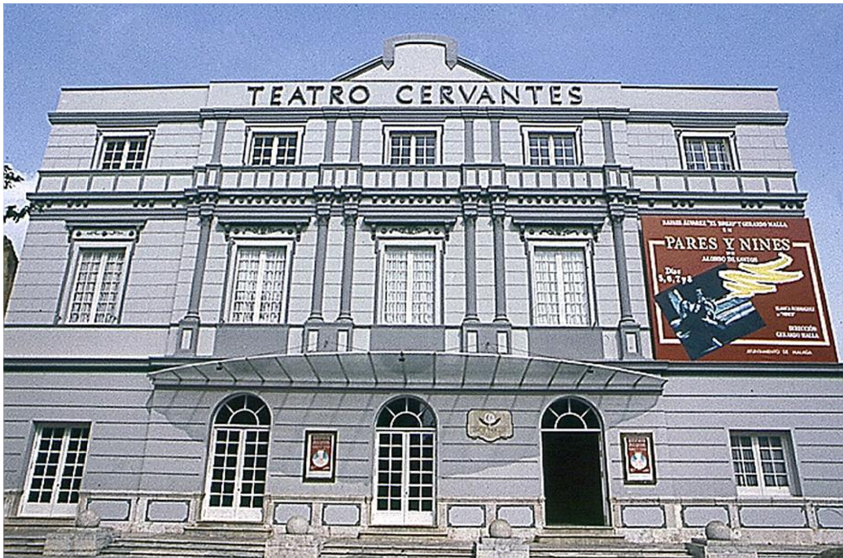
Fachada del Teatro Cervantes (Málaga) tras la rehabilitación. Consejería de Fomento y Vivienda